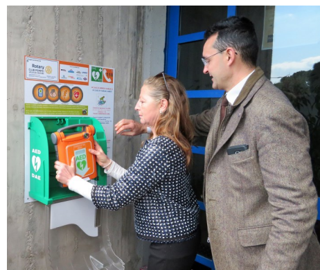
La messa in situ del defibrillatore