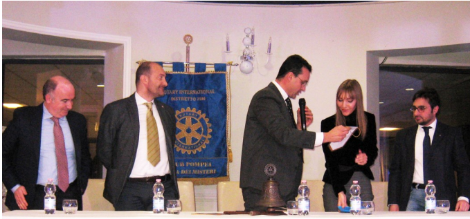
Il presidente offre il labaretto alla scrittrice