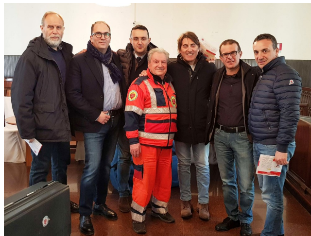
Il gruppo organizzatore del corso

Il corso è stato organizzato con una prima sessione di teoria, durante la quale sono state illustrate le modalità di intervento e rianimazione. Dopo un break si è passati nel vivo del corso, con prove pratiche di BLS-D, con l'ausilio dei manichini. Tutti i parteci-