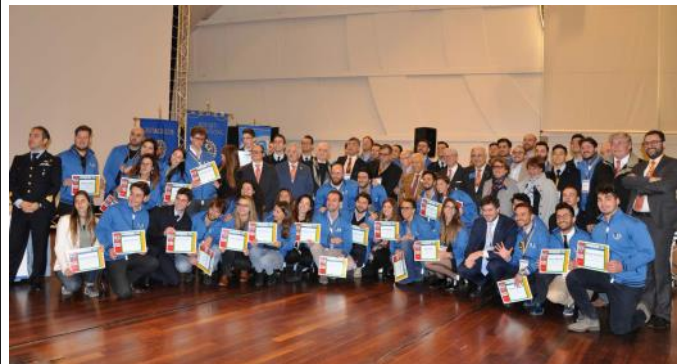
I giovani partecipanti al Ryla con i rotariani organizzatori dell'evento