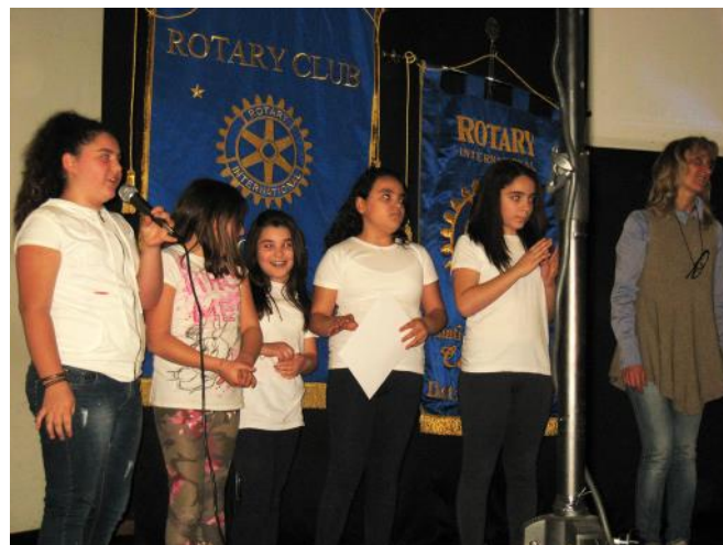
Alunni premiati accompagnati da un docente

gnato alla Scuola Media Martiri d'Ungheria, Scafati, il 2° premio alla Scuola Media mons. Vassalluzzo, Roccapiemonte, il 3° premio alla Scuola Media d'Aosta, Ottaviano. La manifestazione, assai ben riuscita, è stata seguita da circa trecento ragazzi.