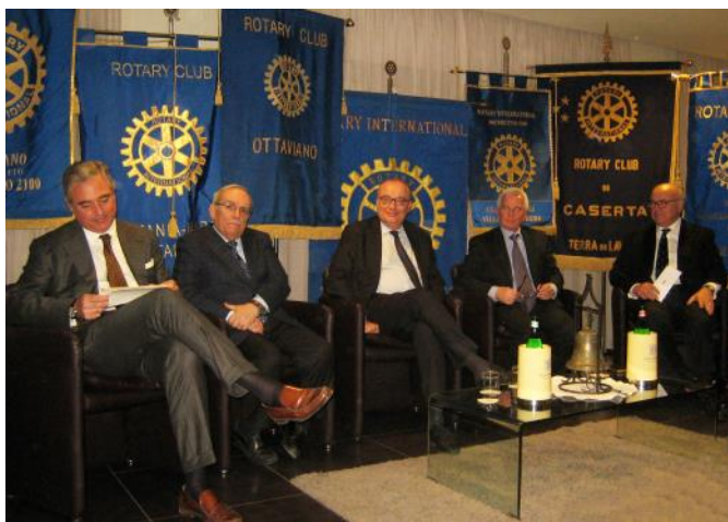
Il tavolo dei relatori dell'incontro