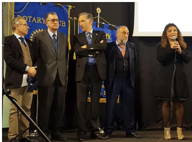
Presidenti e delegati portano il saluto dei rispettivi Club

gnato alla Scuola Media Martiri d'Ungheria, Scafati, il 2° premio alla Scuola Media mons. Vassalluzzo, Roccapiemonte, il 3° premio alla Scuola Media d'Aosta, Ottaviano. La manifestazione, assai ben riuscita, è stata seguita da circa trecento ragazzi.