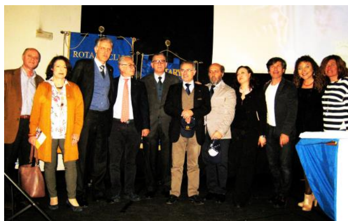
I rappresentanti dei Club aderenti al progetto