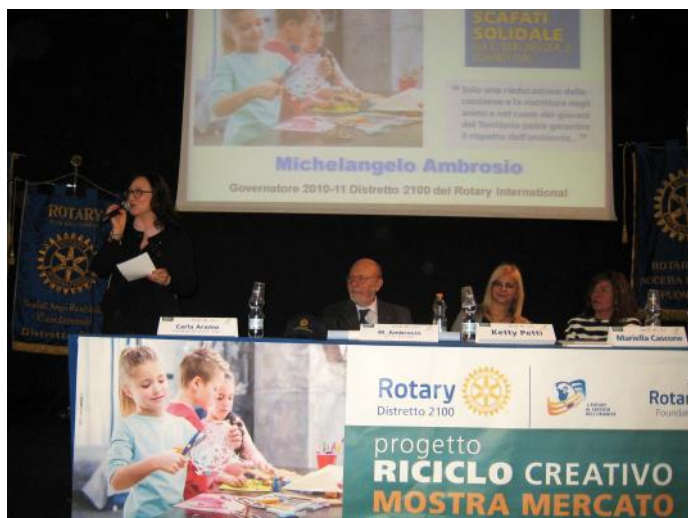
Il tavolo dei relatori