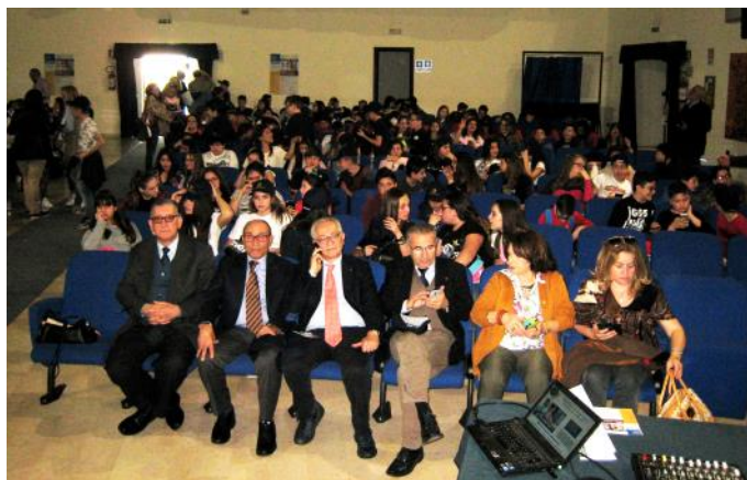
Il teatro gremito di studenti e docenti

Una rappresentanza del Club con il segr. Casale ha partecipato alla Mostra Mercato , vendita dei lavori prodotti dalle Scuole partecipanti al progetto, e alla Manifestazione di Premiazione del Progetto Riciclo Creativo , nell'ambito del Progetto interclub Fiume Sarno . Undici le Scuole Medie Inferiori, presenti con alunni e docenti, le quali hanno allesti-