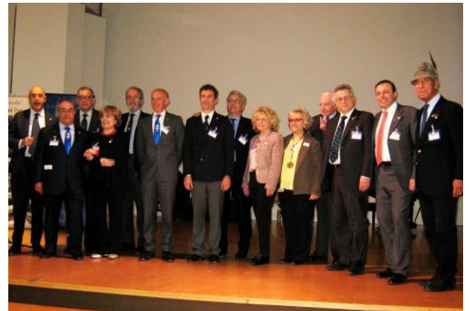
Presidenti e delegati delle fellowships presenti