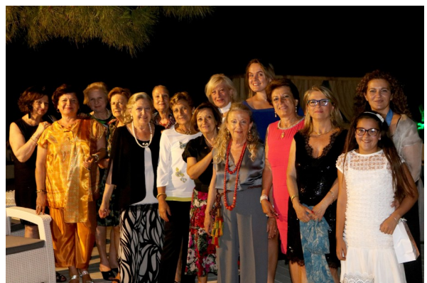
Le socie Inner Wheel Pompei Oplonti Vesuvio Est