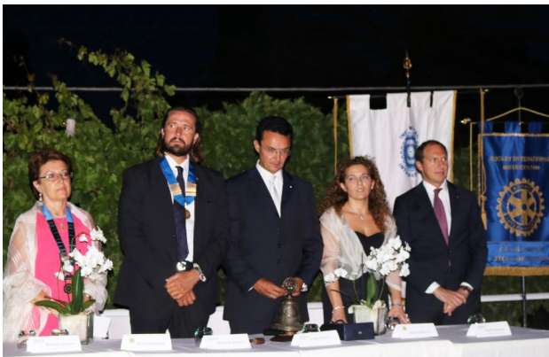
Il momento degli onori alle bandiere