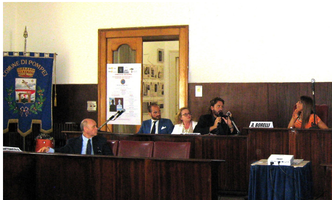
Il pres. Autieri introduce i lavori del Convegno

Pompei, ristorante Tiberius giovedì 29 giugno 2017, ore 20,30