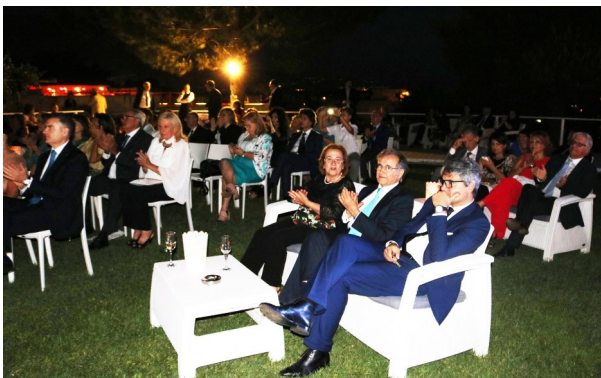
Ospiti e soci nel corso della serata